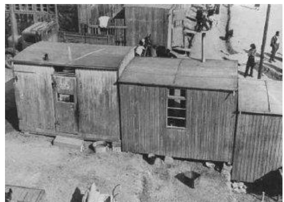
Campo de concentración de Auschwitz.