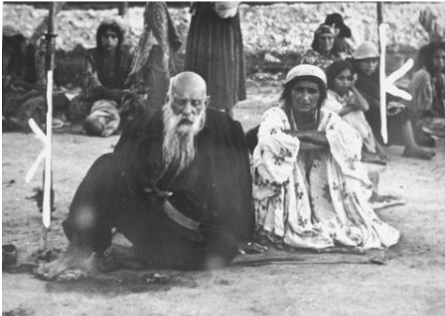
Campo de concentración de Auschwitz.

Todavía hay una gran falta de datos para medir el alcance del Holocausto Gitano . Sólo en Auschwitz , el número de romaníes registrados alcanzó el 20.933, incluyendo 360 niños nacidos en este campo de concentración, y que vivieran lo suficiente para recibir un número de registro. A éstos se añaden aproximadamente 1.700 Roma enviados a las cámaras de gas en el momento que llegaron al campo, en marzo de 1943. En un solo día - 29 de mayo de 1943 - 102 romaníes fueron arrastrados para fuera de sus instalaciones y llevados a las cámaras de gas.