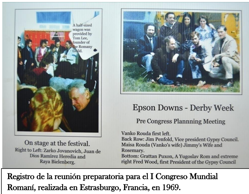
Registro de la reunión preparatoria para el I Congreso Mundial Romaní, realizada en Estrasburgo, Francia, en 1969.