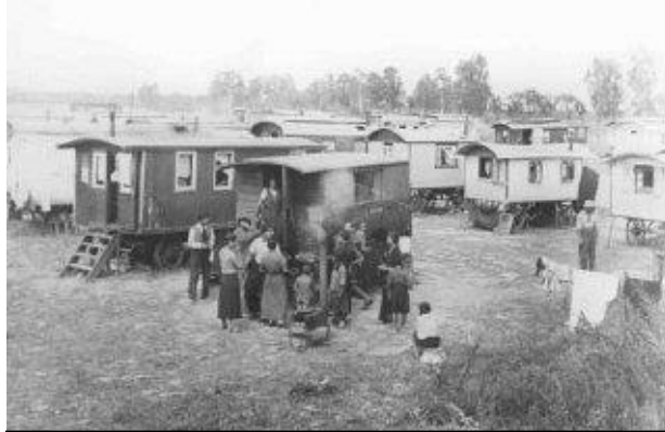
Campo de concentración de Auschwitz.