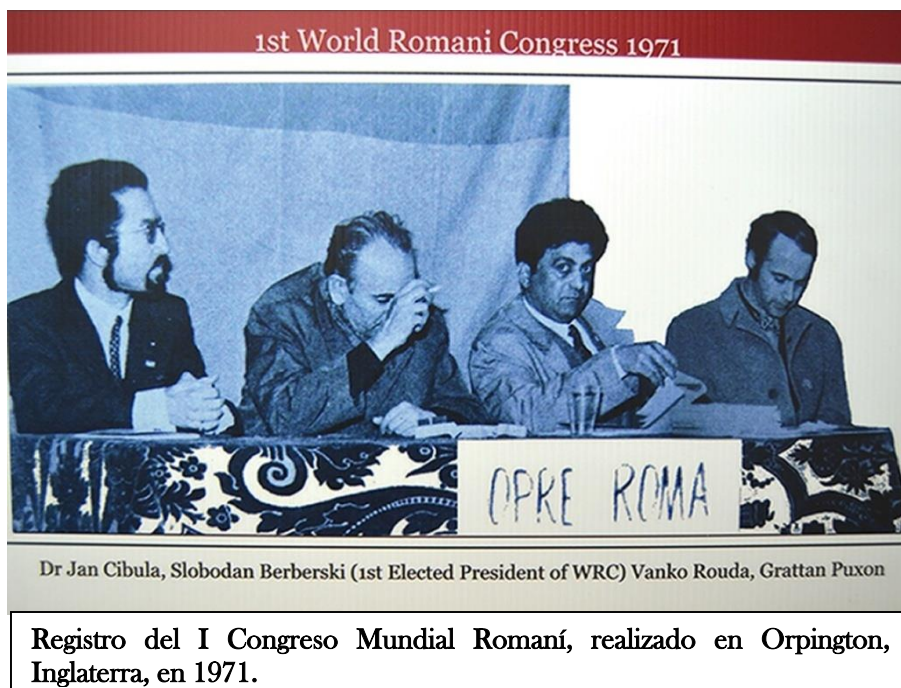
Registro del I Congreso Mundial Romaní, realizado en Orpington, Inglaterra, en 1971.

Gelem Gelem (Djelem Djelem) es el himno de los Rroma. También conocido como Белем, Целем, Джелем, Zhelim, Opré Roma y Romane Shavale , y significa "caminé, caminé".