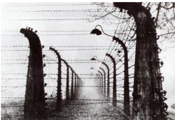
Campo de concentración de Auschwitz.

En el período 1941-1945, hay muchos testimonios sobre masacres colectivas, muertes individuales, torturas de todo tipo, experimentos químicos y médicos aplicados a los Rroma. Acciones de este tipo se llevaron a cabo en varios campos de concentración: Auschwitz, Birkenau, Mauthausen, Rabensbruch, Buchenwald, Chelmo, Lodz, Dachau, Sachsenhausen y Lackenbach . A Auschwitz fueron enviados Rroma de diferentes nacionalidades, incluyendo soldados alemanes de permiso del frente militar, algunos de ellos condecoradas por su valor en combate.